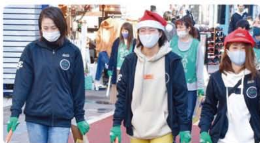
TOKYO DIMEの選手と一緒に 渋谷ゴミ拾い活動