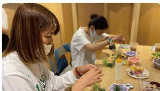
シリコーンをつかった オリジナルコースター作り